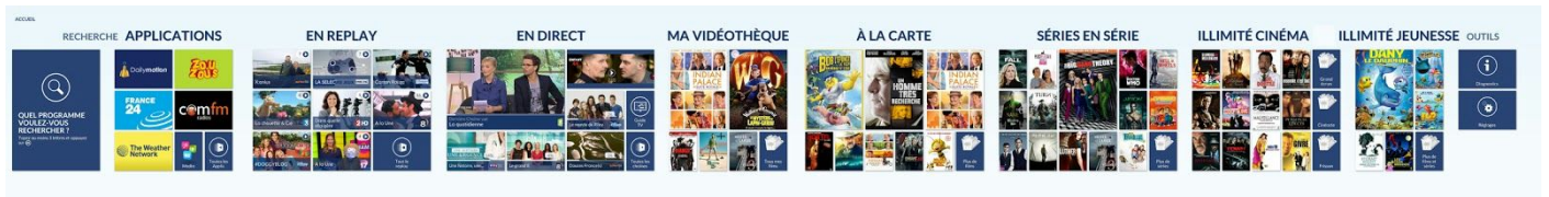
Interface LA FIBRE videofutur

LA FIBRE videofutur s'appuie sur une nouvelle interface multi-écrans développée par Netgem et ainsi offre la meilleure expérience TV.